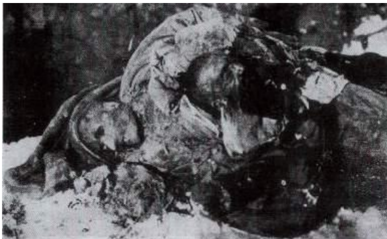
Ərzincanın Odabaş məhəlləsində gözləri ovularaq şəhid edilmiş türklərdən bir neçəsi