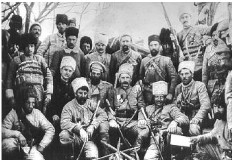
Erməni silahlı dəstələrindən bir qrupu