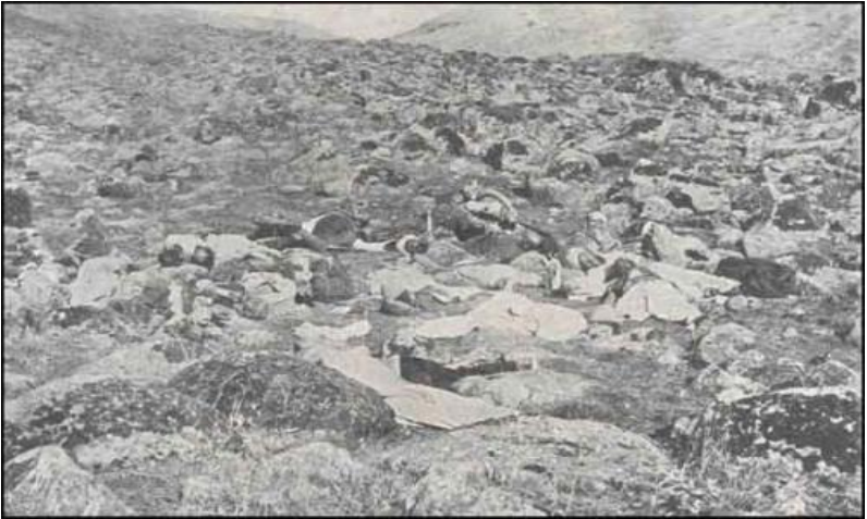
Ermənilərin Van şəhərində qətlə yetiridkləri türk əsgərləri