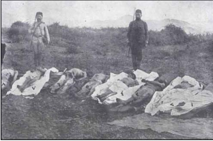
İzmitin Kollar kəndində balta ilə qətlə yetirilmiş türklər