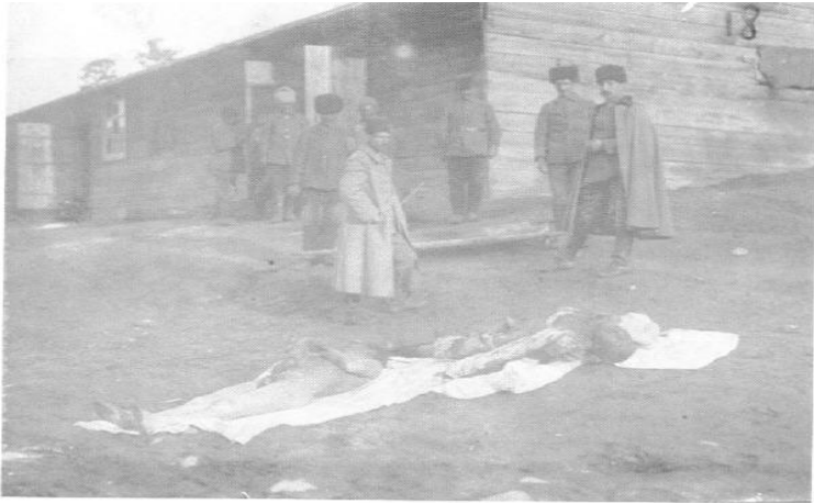
Ermənilər tərəfindən Sarıqamışda süngüyə keçirilərək şəhid edilmiş türk əsgəri