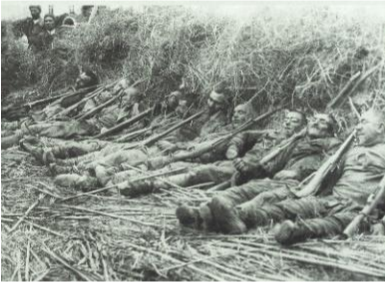
Ermənilərin Sarıqamışda amansızlıqla qətlə yetirdikləri türk əsgərləri