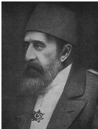
Ermənilərin "Qızıl Sultan" adlandırdıqları II Əbdülhəmid