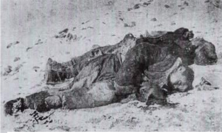
Ermənilərin Ərzincanda qətlə yetirdikləri türk uşaqları